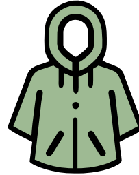
Impermeable o prenda apta para protegerte de la lluvia.