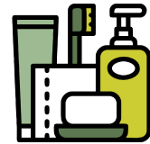
Artículos de higiene personal

Si tenés algún tipo de alergia es recomendable que traigas tus medicamentos para prevenir cualquier eventualidad, y es importante que se lo hagas saber a tu coordinador al completar la ficha de datos personales.