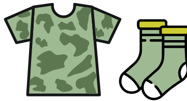
Muchos pares de medias y prendas resistentes para el trabajo de campo