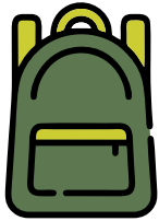
Mochila personal (35/40 litros)

Te sugerimos traer estos elementos importantes para desempeñarte en campo y estar cómodo durante tu tiempo de voluntariado en la selva.