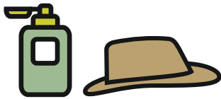
Protección para el sol (gorra o sombrero, pantalla solar)